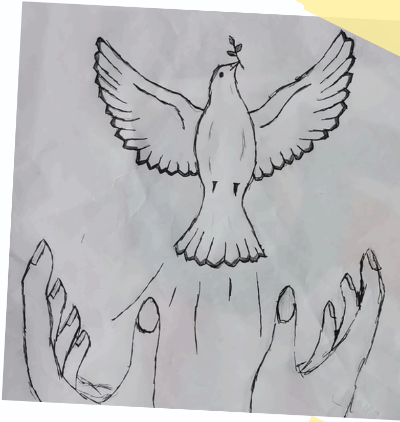
EDİBE ESMER 8/E